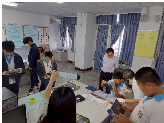
商品拍攝練習~自行打燈