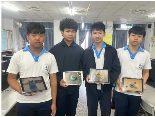
師長票選最佳作品