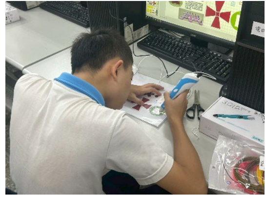
體驗 3D 列印筆~出線速度控制