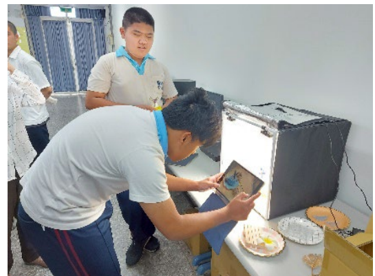
商品拍攝練習~小型攝影棚