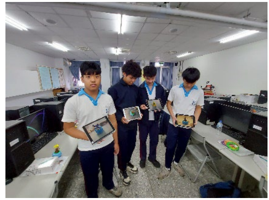
師長票選最佳作品