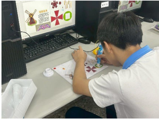
體驗 3D 列印筆~出線速度控制