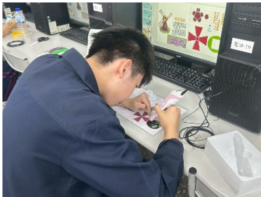
體驗 3D 列印筆~平塗練習