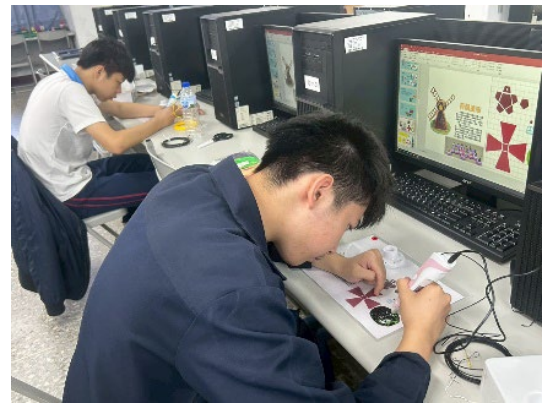
體驗 3D 列印筆~平塗練習