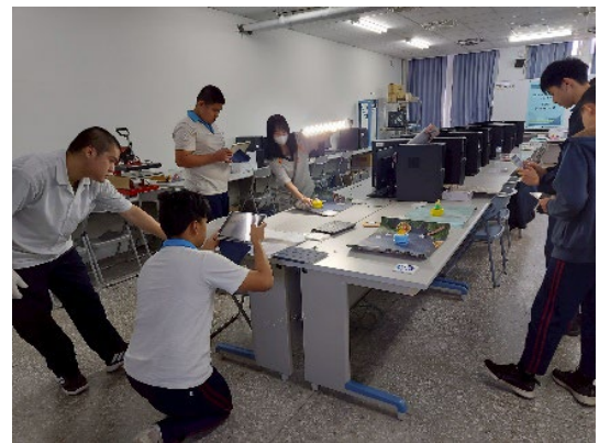
商品拍攝練習~自行打燈