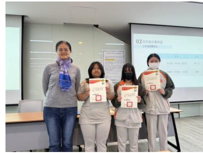
會計大會考獎狀頒發