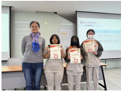
會計大會考獎狀頒發