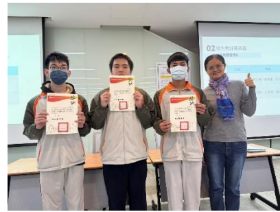
會計大會考獎狀頒發