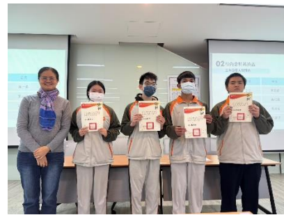
會計大會考獎狀頒發