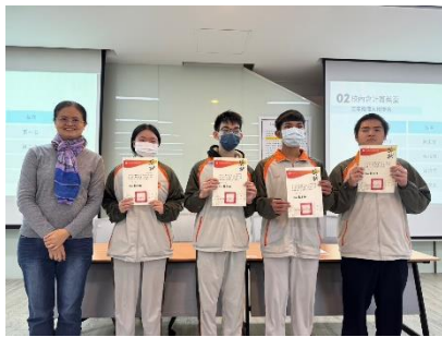
會計大會考獎狀頒發