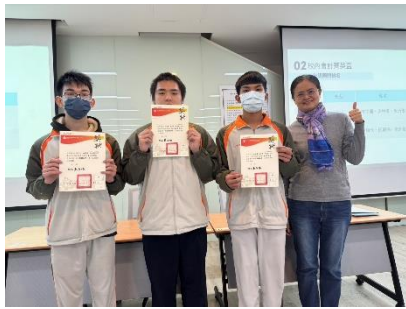
會計大會考獎狀頒發