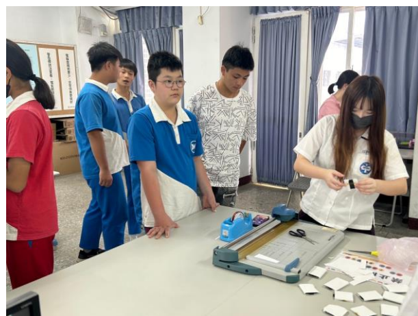
學姊協助紙張與材料結合