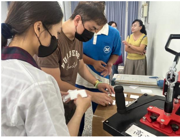
老師指導機器操作方式