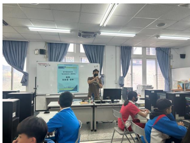
老師講解課程進行方式