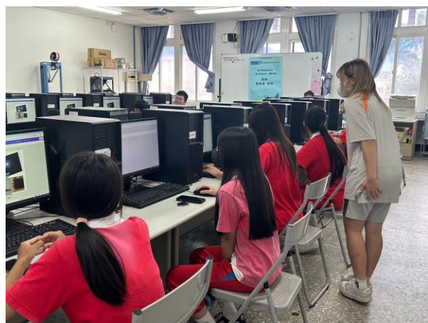
學姊協助電腦設計