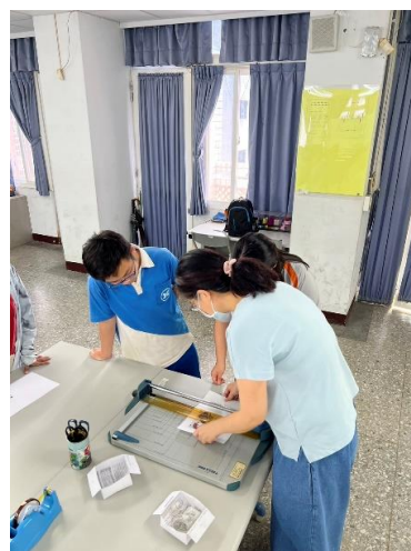
老師教導裁紙機使用方式