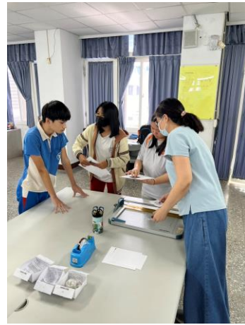
老師指導紙張與材料結合方式