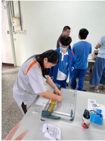
學姊協助紙張裁剪