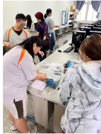
學姊協助紙張裁剪