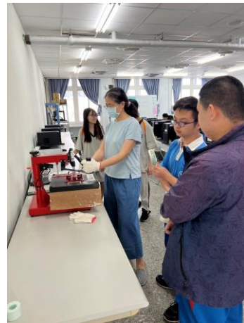
老師展示機器操作方式