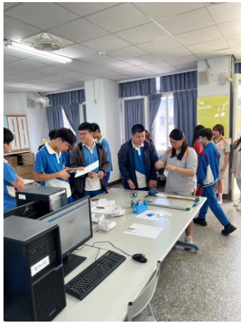
學姊協助紙張裁剪