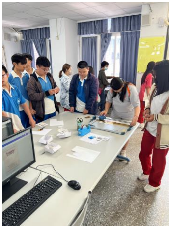
同學們準備作品熱壓中