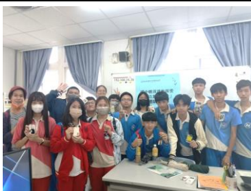
全體創作作品展示