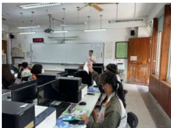
三點一刻 DIY 活動