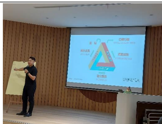
新媒體行銷模式講解