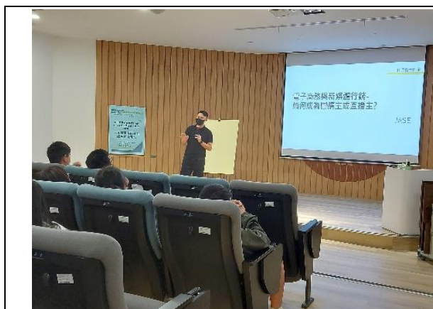
電子商務趨勢介紹