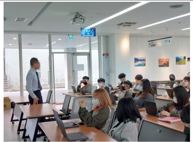
教授與學生問答互動