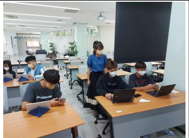
課堂教師協助學生練習