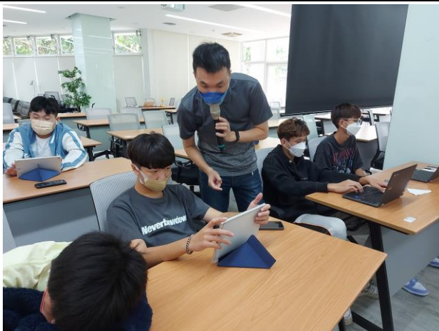
講師與學生問答互動