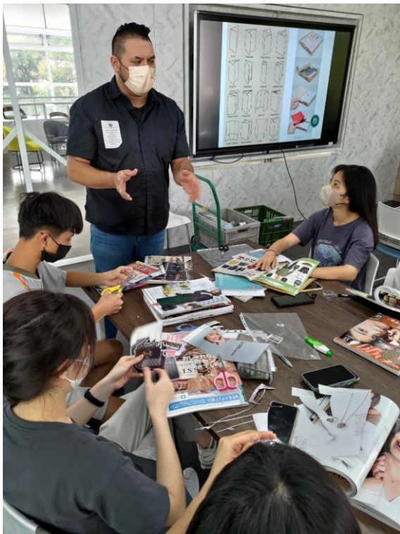
講師與學生問答互動