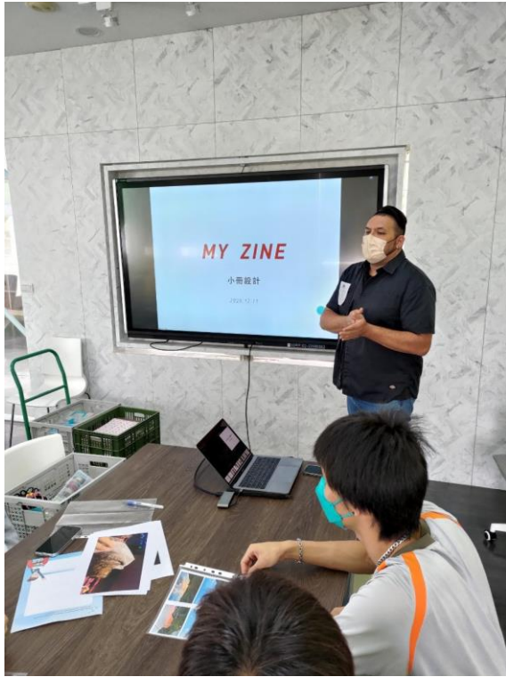
講師介紹自己跟課程