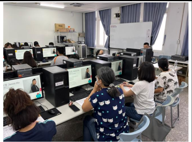
教師一同參與研習