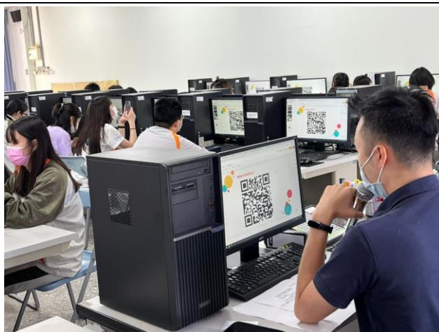
講師與學生問答互動