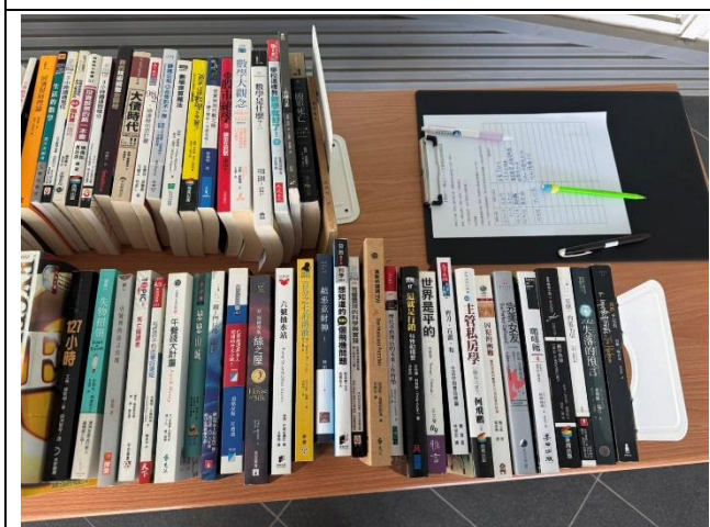
二手書籍與領取紀錄單