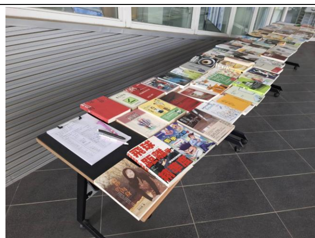
二手書籍與領取紀錄單