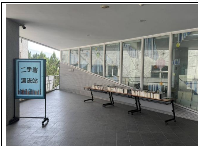
設置二手書漂流站