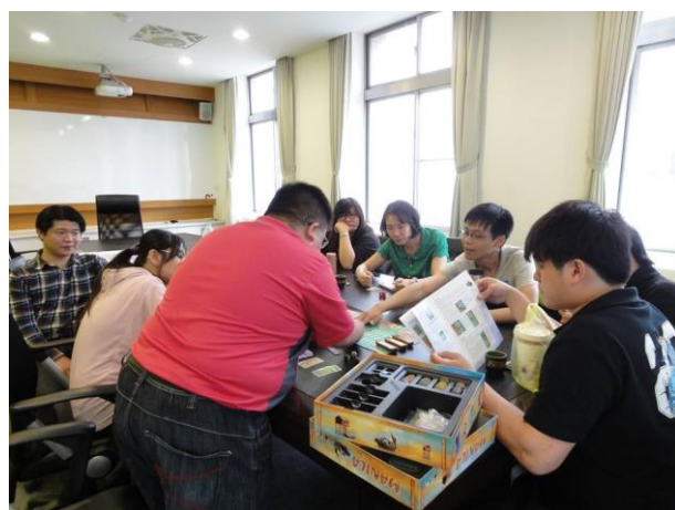
科學與文創科技結合分析