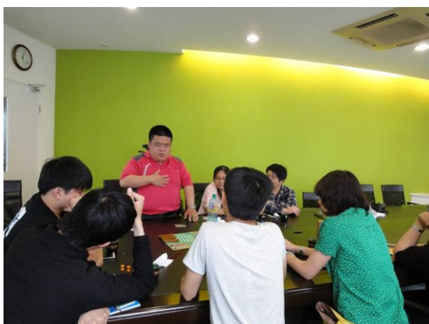
科學課程結合辦法評估