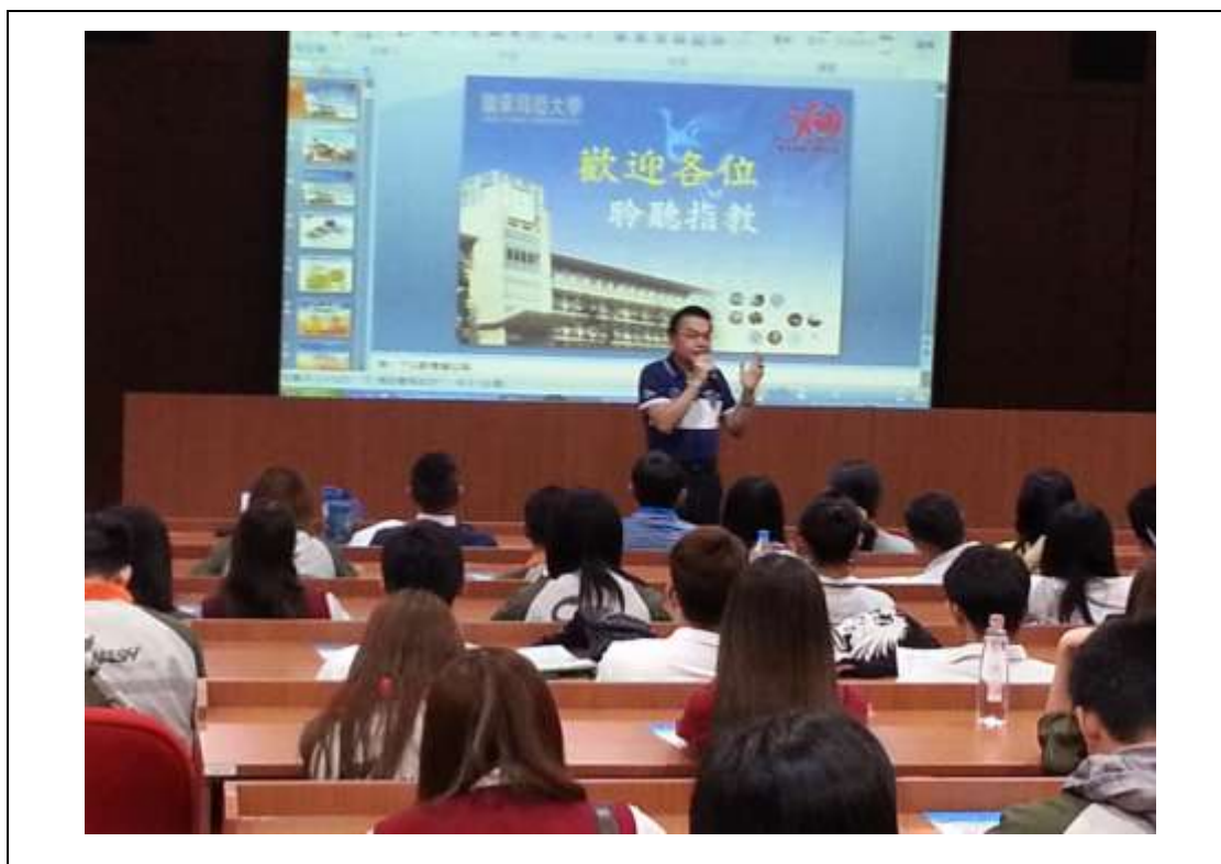
管理學院院長對同學表達歡迎