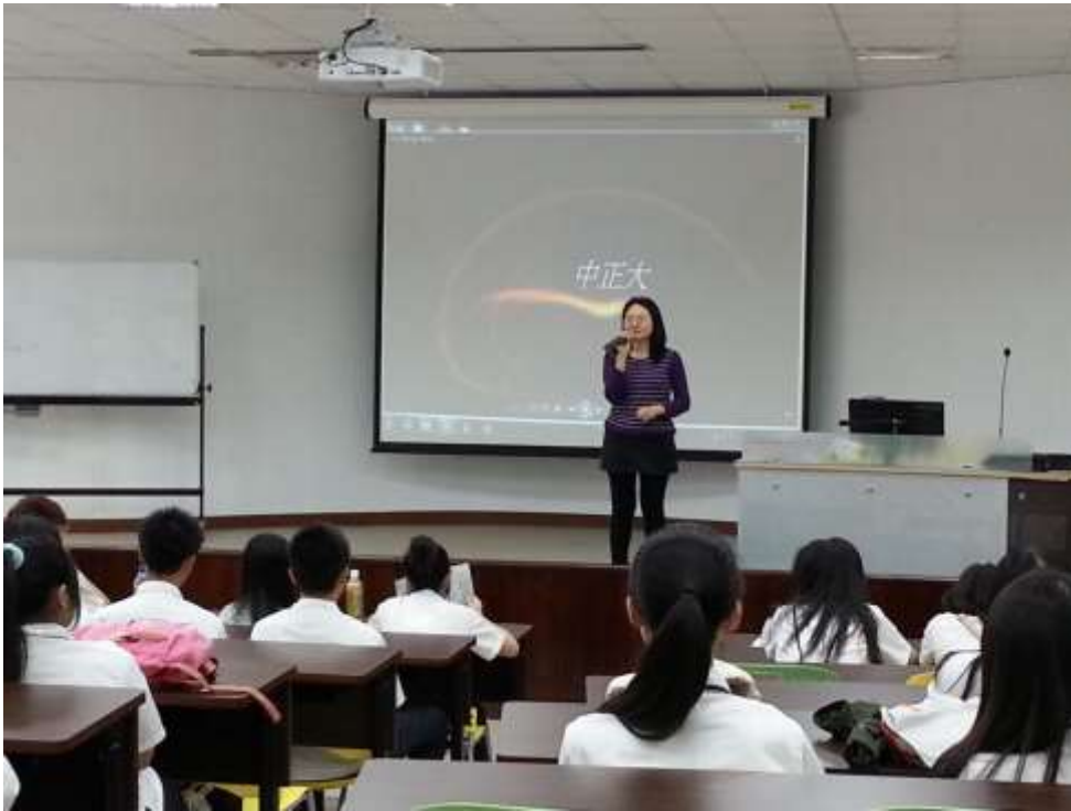
中正大學心理系的介紹影片，讓同學馬上對心理學有所認識。