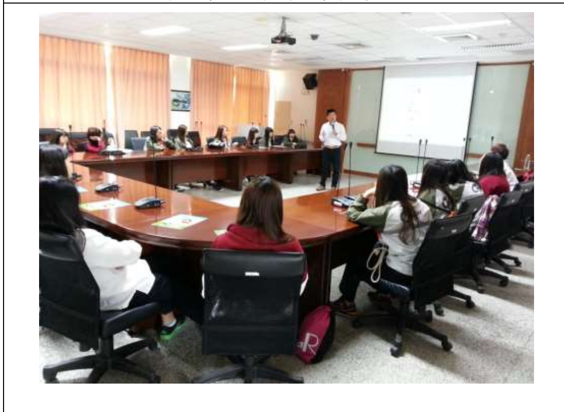
透過體驗課程，瞭解行銷的重要性與意義。